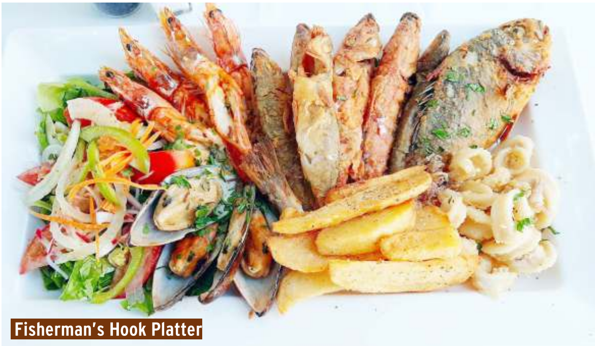
Fisherman's Hook Platter