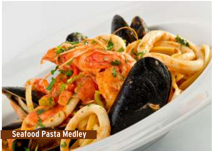
Seafood Pasta Medley