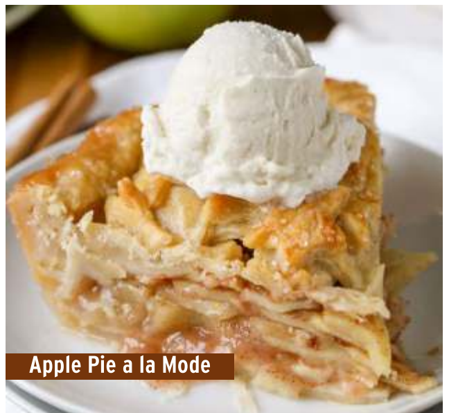
Apple Pie a la Mode