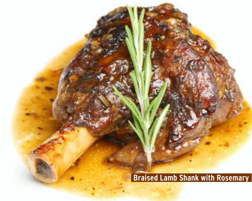
Braised Lamb Shank with Rosemary