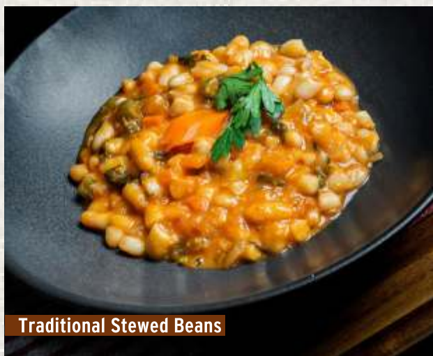
Traditional Stewed Beans