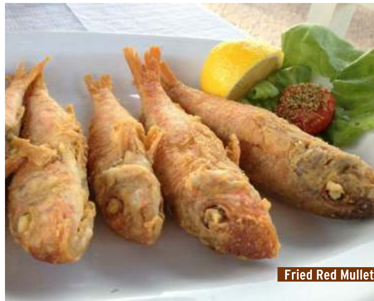
Fried Red Mullet